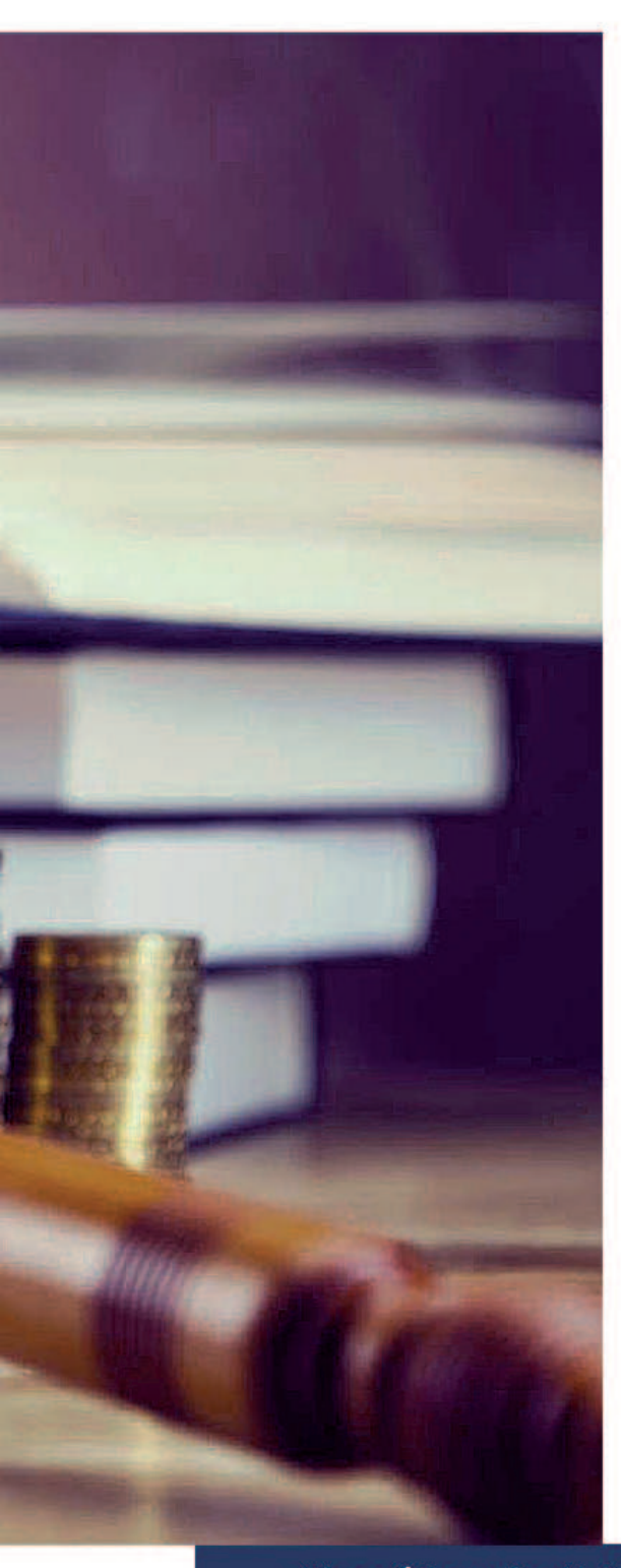
ی، منظور از موافقت نامه، توافقاتی است که دو دولت در مورد سرمایه گذاری های اتباع خویش در خاک دیگری، پیش بینی های لازم را مقرر می کنند و به عنوان یک سند بین السللی احتبار خواهد داشت. پیش بیش هایی که در این موافقت نامه ها می شود در بسیاری موارد، خودبخود بر قراردادهای سرمایه گذاری حاکم می شود از جمله ارجاع اختلافات ناشی از مرمایه گذاری به حکمیت.

لذا، با توجه به این ماهیت اختصاصی است که حکمیت سیر تکامل خود را خصوصاً در حوزهٔ سرمایه گذاری خارجی طی می کند؛ چنانکه برخلاف حکمیت تجارتی، ورود دقواعد شفافیت، و اکتوانسیون شفافیت، در حکمیت های سرمایه گذاری خارجی، زمینهٔ ورود ثالث را بدون رضایت طرفین اختلاف نیز فراهم می کند، فراهم شده است.